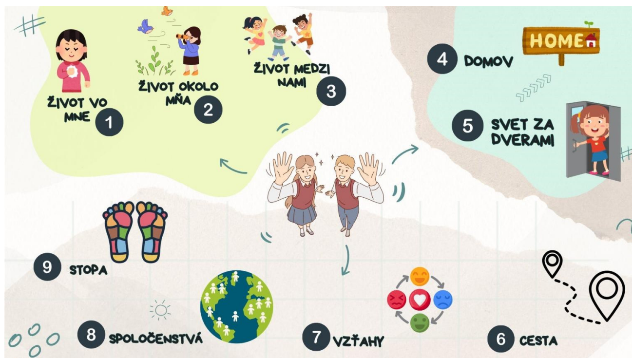
Obrázok č. 5: Ročníkové témy

Cielene sa venujeme integrácii vzdelávacieho obsahu, pričom v 3. cykle sa zameriavame na využívanie odborných učební. Kmeňové triedy sa zároveň stali odbornými učebňami s potrebnými pomôckami. Zároveň sme vytvorili ročníkové témy pre všetkých 9 ročníkov (viď. obrázok 5).